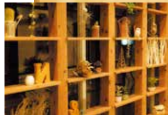
■ウッド調で柔らかい雰囲気の店内